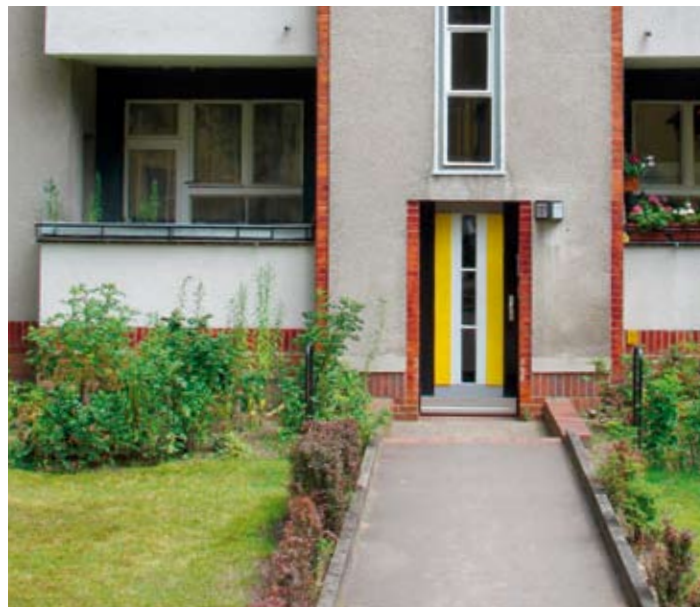
» Auch die Waldsiedlung (links) und die Hufeisensiedlung (rechts)