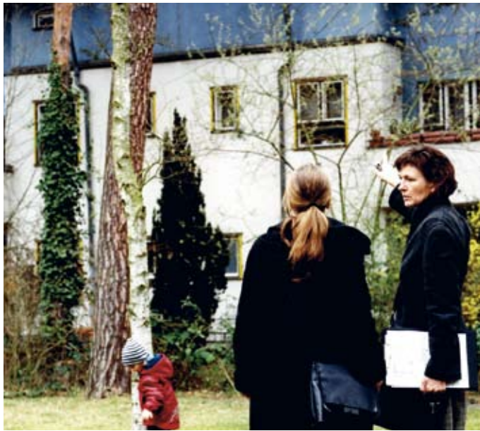
stehen für die Verschmelzung von Tradition und Moderne