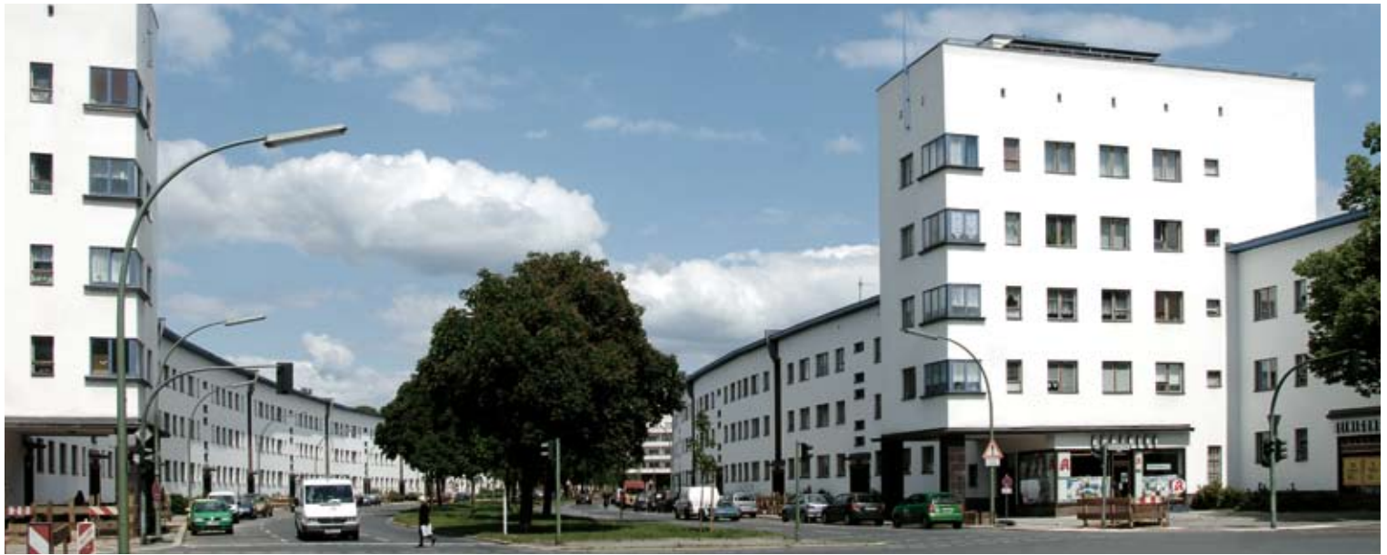
» Die Weiße Stadt – eines der Highlights unseres Berliner Bestandes